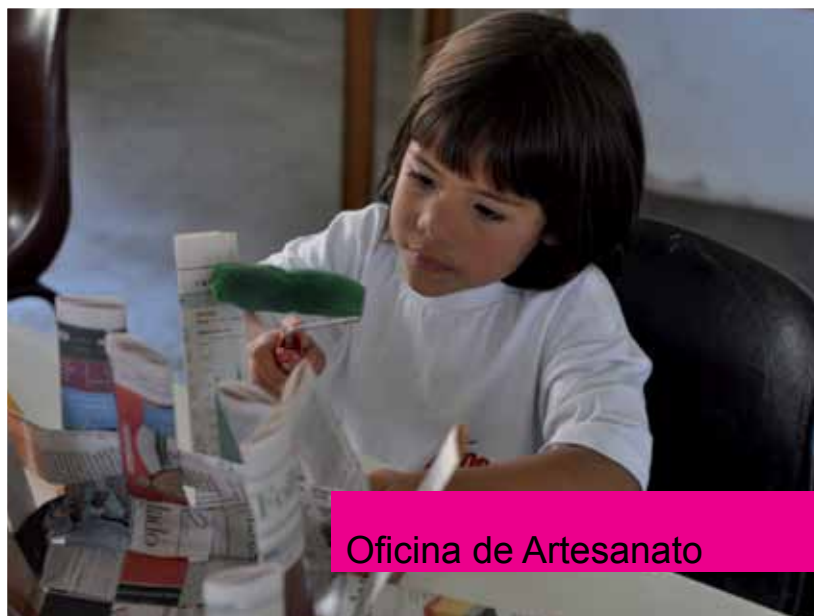
Oficina de Artesanato