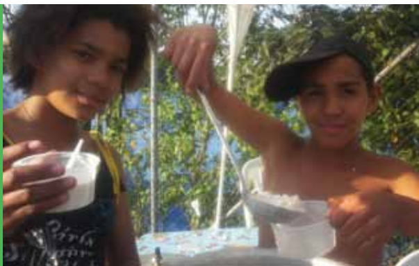
Equipe da região Centro-Oeste, servindo uma deliciosa Canjica.